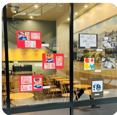
スターバックスコーヒー 静岡アピタ店