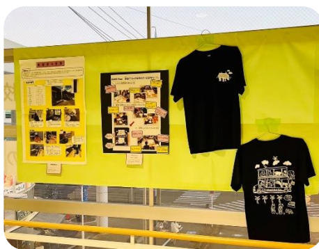
アピタ静岡空中通路