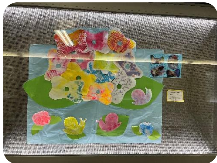
地下道ギャラリー