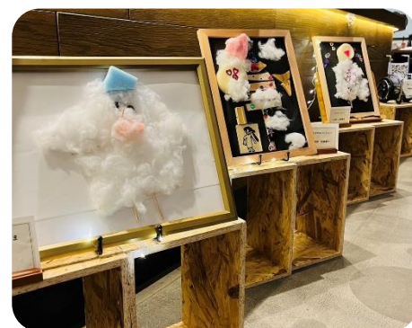
スターバックスコーヒー 静岡中原店