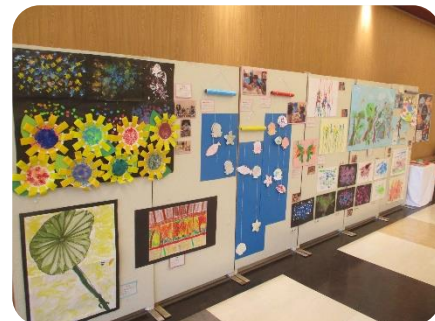
ベイドリーム清水